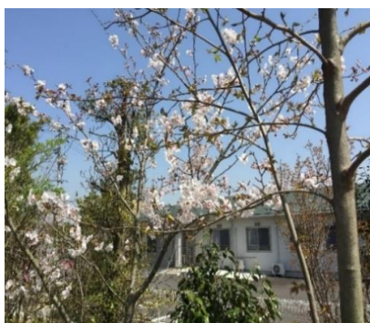
季節によって変化する周辺環境。

当施設には福祉施設で長年経験を積んだ職員を含む、笑顔のたえない明るく元気な職員が皆さまをお迎え致します。また、利用者さまの安心と安全を守り、明るくあたたかい家庭的な雰囲気を大切に、家族のように寄り添うため、小規模に抑えた施設になっています。